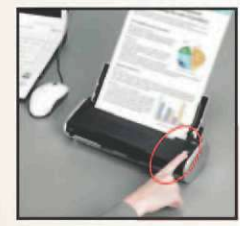
Fonctionnement "Une touche"