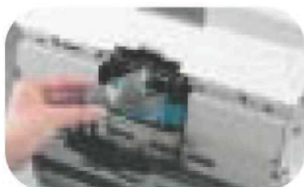
Rouleaux changeables par l'utilisateur