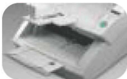
Alimentation extrêmement fiable