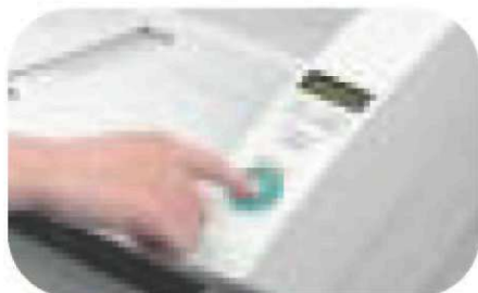
Panneau de contrôle simplifié

Afin d'améliorer substantiellement les vitesses de numérisation, les deux modèles disposent de la compression JPEG interne et de nouveaux capteurs CIS (Contact Image Sensor). Vous atteignez ainsi des vitesses supérieures à 90 ppm aussi bien en N&B ou en niveaux de gris (A4 portrait, 200 ppp) qu'en couleur (A4 portrait, 100 ppp) 1 . Ajoutez à cela une vitesse maximale de 180 ipm en Recto/Verso et vous bénéficiez d'une productivité incomparable.